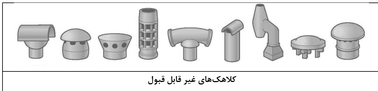
شکل ۲- انواع کلاهک‌های قابل قبول و غیرقابل قبول

استفاده از کلاهک دودکش الزامی است. شکل ۲ کلاهک‌های غیرقابل قبول را نشان می‌دهد. کلاهک دودکش به هر شکلی که ساخته شود مجموع مساحت خالص دهانه خروج دود باید دست کم دو برابر سطح مقطع دودکش باشد. قطر داخلی دهانه اتصال کلاهک به دودکش باید با قطر خارجی دودکش برابر و یا به میزان خیلی جزئی بزرگ‌تر از آن باشد.